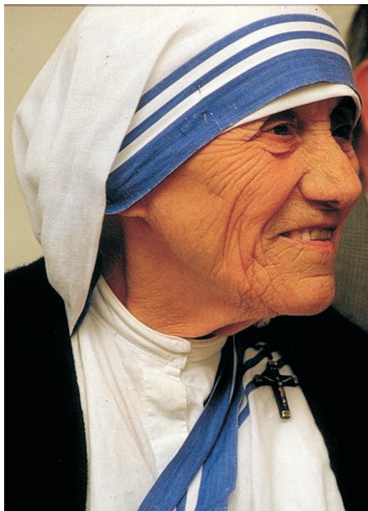
Moder Teresa på sine ældre dage

lem Månen og Saturn, så vælger jeg i denne form for horoskop at se det som en konjunktion. For Moder Teresa var det at lide materiel afsavn en naturlighed – men en katastrofe at lide afsavn på det spirituelle og åndelige plan, som det åbenbares i hendes breve. Hendes livslange kærlighed til Jesus blev kortvarigt gengældt i 5 uger i 1959. Måne/Saturn konj taler for sig selv.